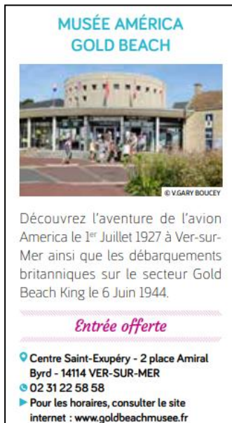
Photo du site / de l'offre : merci de nous fournir une photo de bonne qualité , en format paysage , en PNG ou JPEG (minimum 500ko), en précisant obligatoirement les crédits photos et à nous envoyer par mail à cmauguin@ottnormandie.fr avant le 18 mars 2022 .

Lien page Instagram : ex : https://www.instagram.com/otn.normandie/